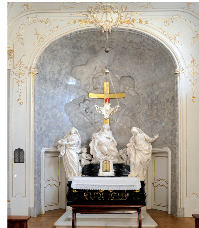
Hauskapelle im neuen Glanz