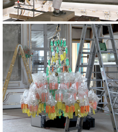
Restauratoren bei der Arbeit