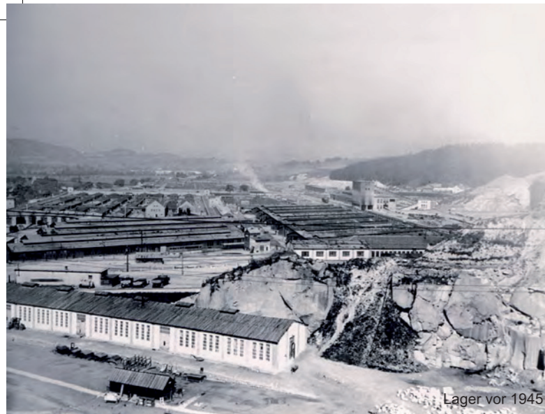
Lager vor 1945