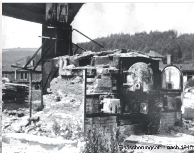
Einäscherungsöfen nach 1945