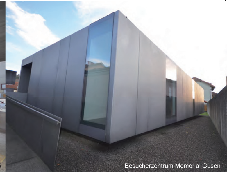
Besucherzentrum Memorial Gusen